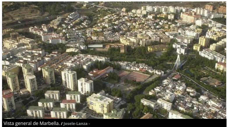
Vista general de Marbella.